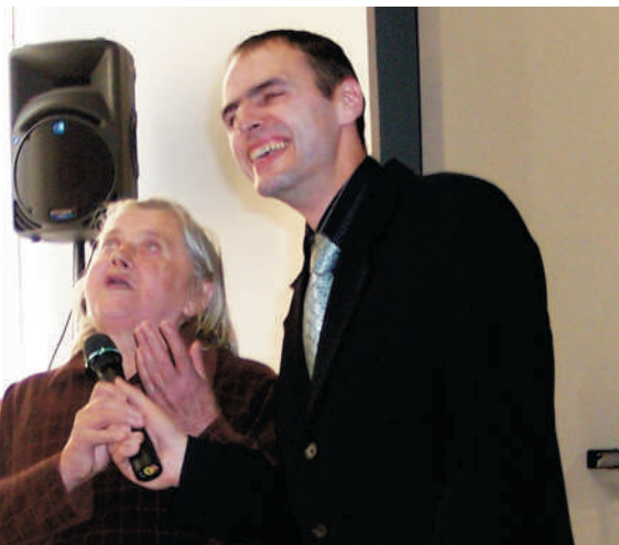
Foto: Rita dievkalpojuma laikā Lielvārdē dalās ar savu prieku (2007. gada 25. aprīlis)

zāles, ja esmu vesela. Pēc diviem mēnešiem, kad devos uz ārstu nozīmēto rentgena pārbaudi, rentgena uzņēmums apstiprināja, ka audzēja vietā ir palicis tikai dobums. Ārsts salīdzināja jauno uzņēmumu ar veco un jautāja: "Kas jūs no tā ir atbrīvojis? Jūs bijāt „norakstīta” kā nedziedināma". Tad arī pastāstīju, ka tikai caur Dievu es esmu tikusi dziedināta.