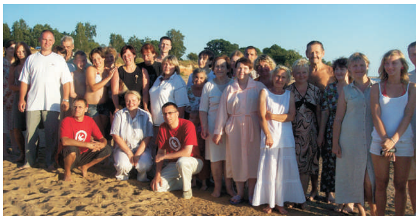
Foto: Draudzes "Kristus Pasaulei" pirmas ūdens kristības Tūjas pludmalē

Pēc kristībām sekoja sadraudzība, sportojot un spēlējot dažādas jautras spēles, kurās aktīvi piedalījās gan bērni, gan sirmgalvj.