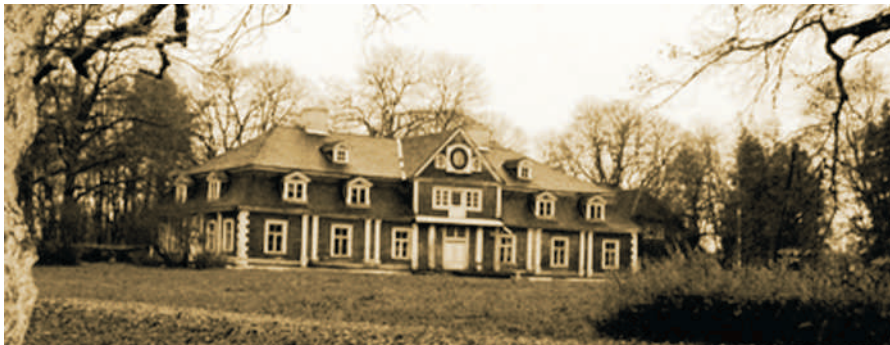
Foto: Ungurmuīža bija viens no brāļu draudžu pirmajiem centriem Latvijā.

Pirmo reizi latvieši tika pulcināti vienkopus no tik plašiem apgabaliem. Līdz tam zemnieki pārvietojās gandrīz vienīgi sava pagasta teritorijā, bet uz brāļu sanāksmēm tūkstošiem vidzemnieku devās no vistālākajiem nostūriem un pārstaigājot krustu šķērsu visu novadu, pamazām guva priekšstatu par Latviju kā visiem kopīgu zemi. Pirmo reizi tik liels latviešu skaits tika iesaiņots tik intensīvā komunikācijā, turklāt tā notika latviešu valodā. Brāļu draudžu sanāksmēs iedzīvotāji no visattālākajiem pagastiem varēja satikties un pārrunāt kopīgās problēmas. Pirmo reizi latvieši no sava vidus izvirzīja līderus, kuri kļuva par vietējo draudžu vadītājiem un runasvīriem. Pirmo reizi latvieši sāka paši un plaši rakstīt, brāļu rokkrastu literatūra kļuva par pirmo latviešu masveida literatūras žanru. Tas bija sākums kopējas latviešu kultūras telpas veidošanai. Pirmo reizi latvieši atskārta, ka ārzemnieki (hernhūtieši jeb "vācu brāji") var nest ne tikai postu, bet arī kaut ko tiešām noderīgu. Pirmo reizi latvieši sevi pieteica plašākai pasaulei kā spējīgus un izglītotus ļaudis. Daudzi no latviešu brāļiem no Vidzemes devās misijas darbā uz dažādām Eiropas valstīm un pat citiem kontinentiem. Paši vidzemnieki tolaik sacīja, ka hernhūtieši viņus atmodinājuši no dziļa un tumša miega, un tā tik tiešām bija latviešu pati pirmā Atmoda. ✨