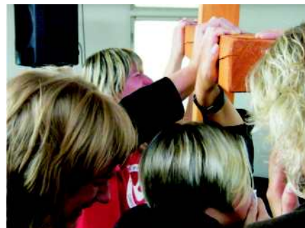
Turpinājums 2. lpp.

Pēc tam veselā dienu notiek atbrīvošana un lēģstu laušana. Lai kā tas nepatīktu reliģiskā draudzēm un to vadītājiem, tā un